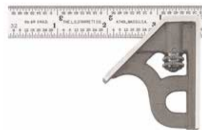
Starrett 4 - Starretts första kombinationsvinkelhake

några av de mest populära på marknaden. Starrett tillverkar idag ett brett utbud av högkvalitativa precisionsmätverktyg, elverktygstillbehör, handverktyg och bandsågblad. De producerar även avancerad mätutrustning och har under de senaste åren lagt till kraftmätning och materialtestutrustning till sin portfölj. Kontakta Marcus Wärn för mer info.